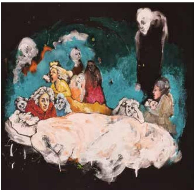
شکوفه کریمی تکنیک: رنگ روغن روی بوم ابعاد: ۸۰*۸۰ سانتی متر ۲۱،۰۰۰.۰۰۰ تومان