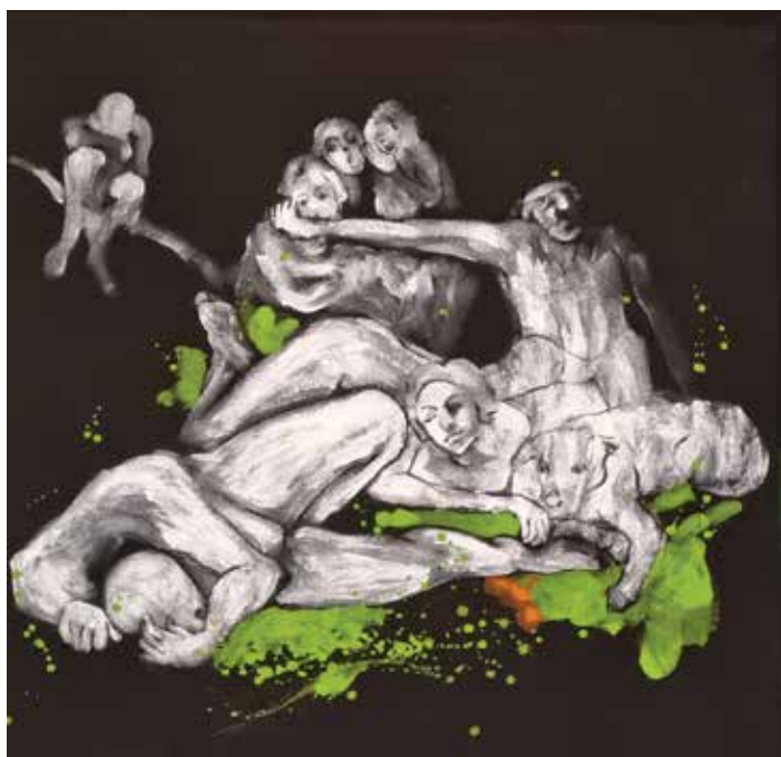
شکوفه کریمی تکنیک: رنگ روغن روی بوم ابعاد: ۸۰*۸۰ سانتی متر ۲۱،۰۰۰.۰۰۰ تومان