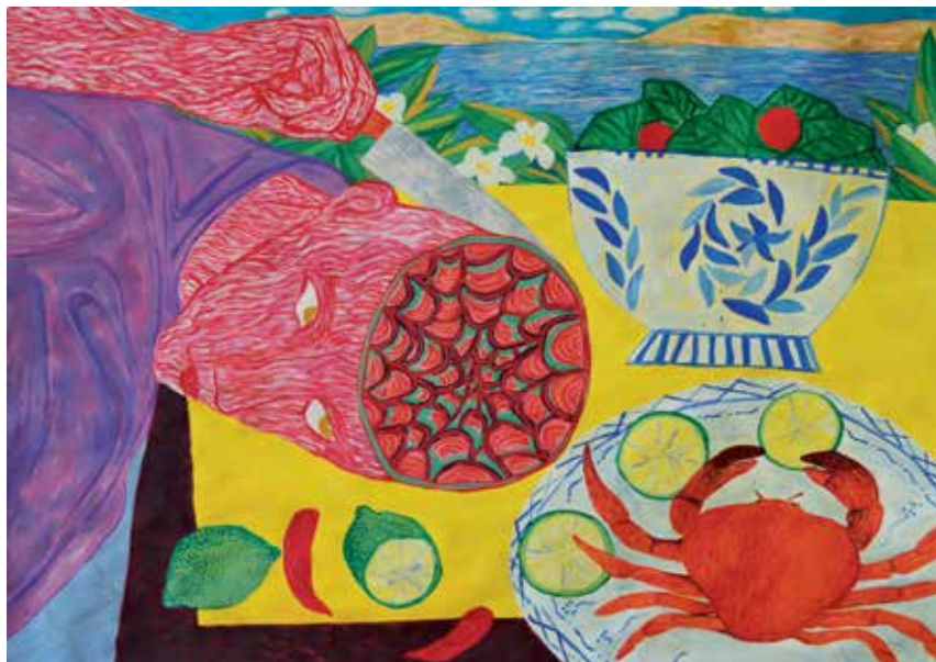
Fatemeh Mansouri-----48x68cm-----Acrylic on cardboard-----2022