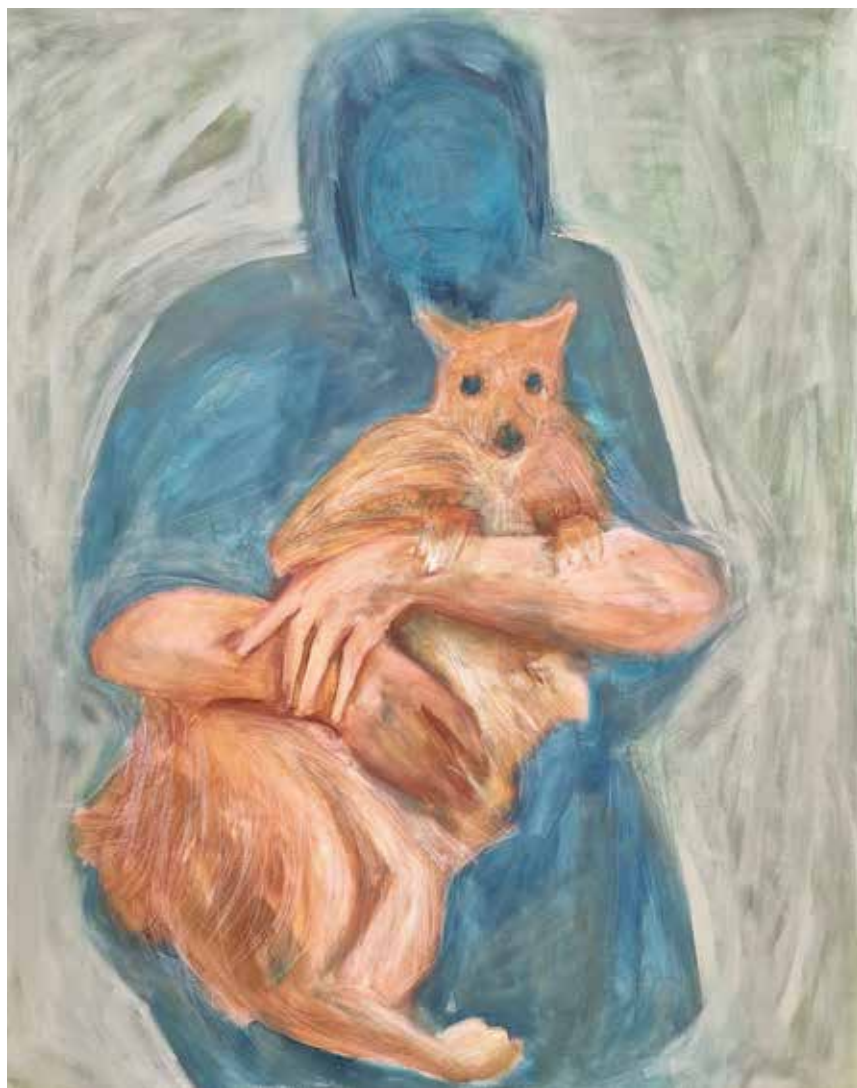
Hasti Tabatabaei-----79x99cm-----Acrylic on canvas-----2022