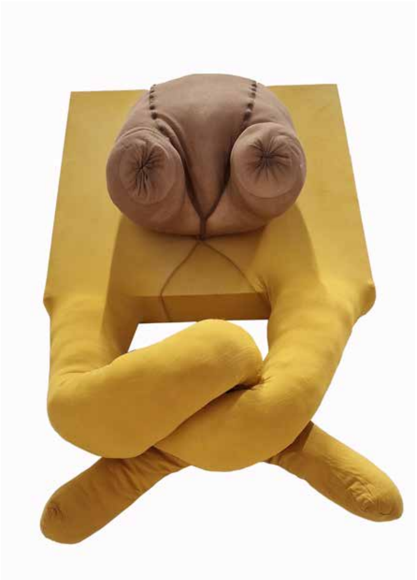
Maryam Radmehr-----40x63cm-----Fabric collage and canvas-----2022