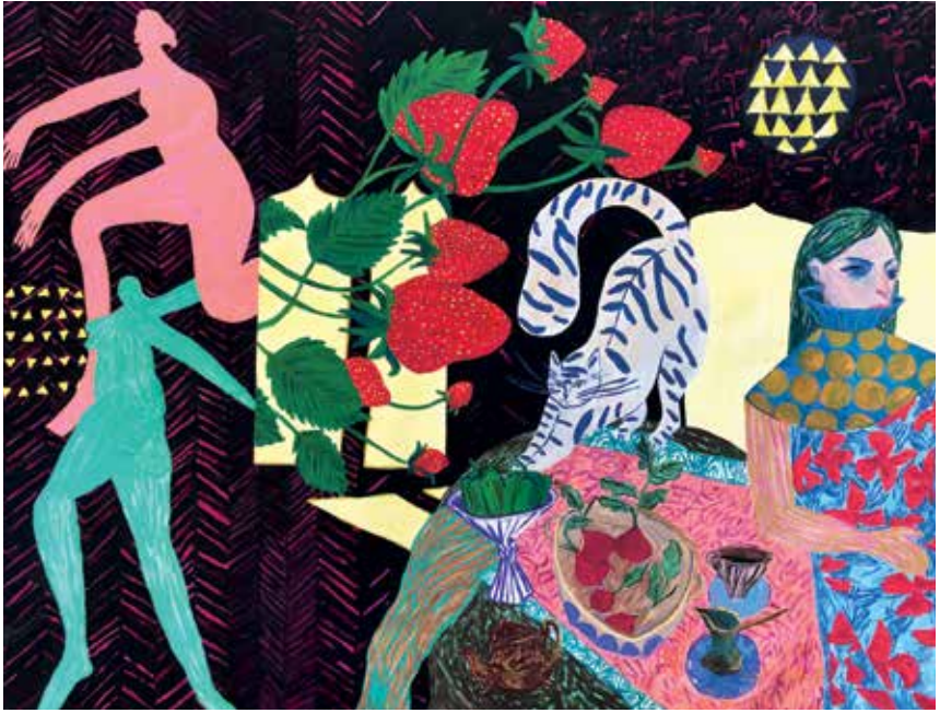
Fatemeh Mansouri-----48x68cm-----Acrylic on cardboard-----2022