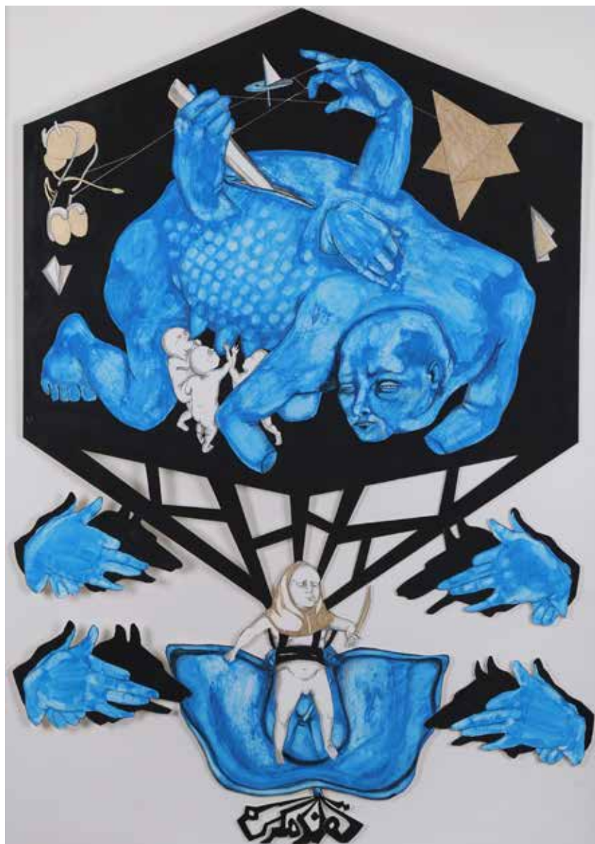
Donya Rostami-----73x103-----Mixed media on cardboard-----2017