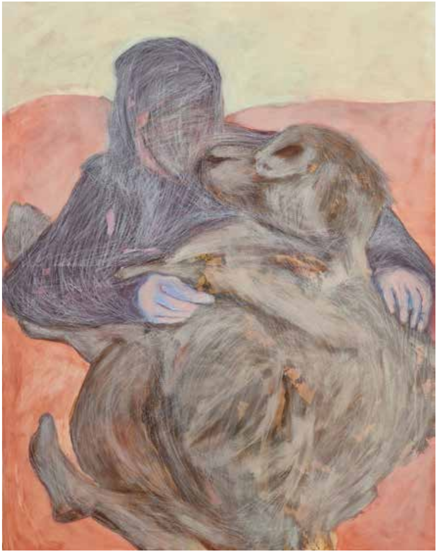
Hasti Tabatabaei-----79x99cm-----Acrylic on canvas-----2022