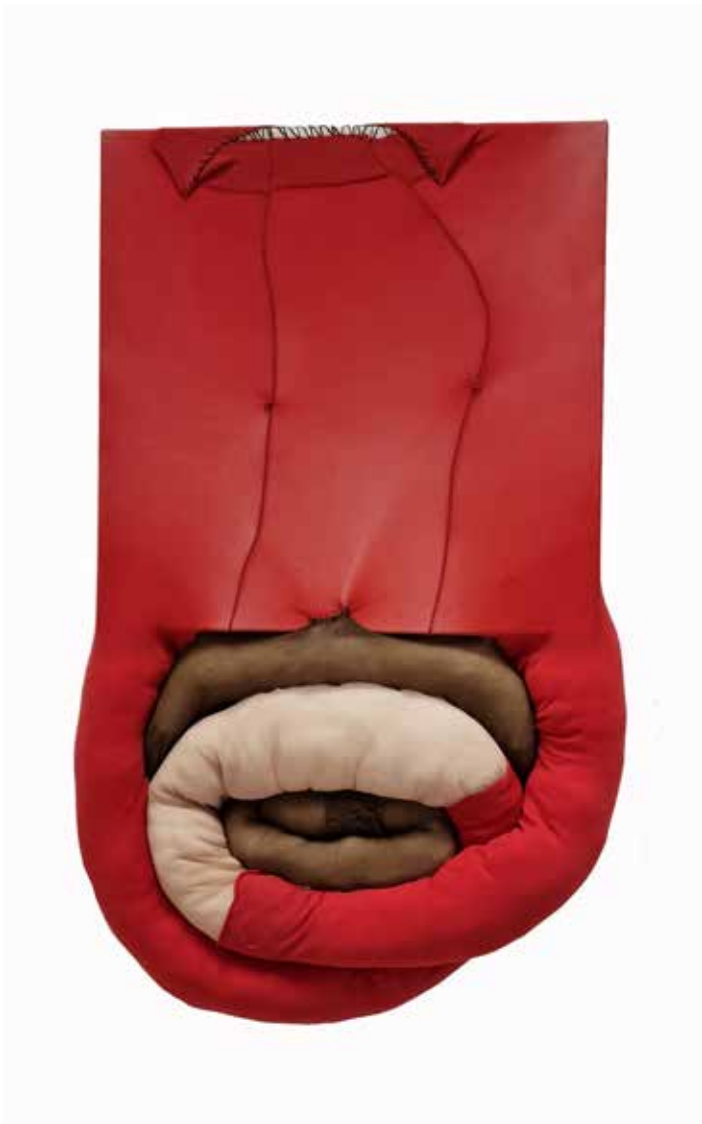
Maryam Radmehr-----40x66cm-----Fabric collage and canvas-----2022