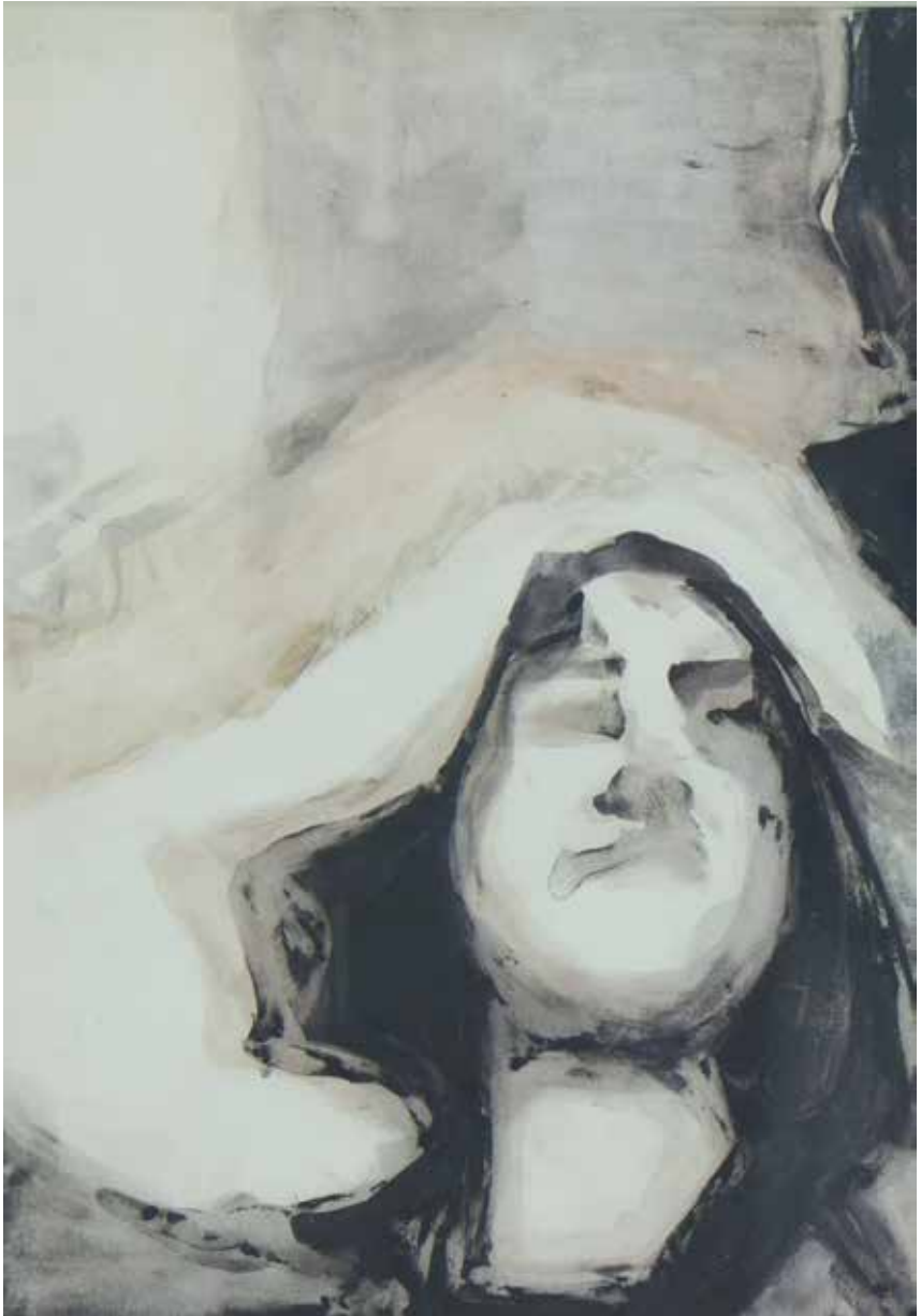
Hasti Tabatabaei-----35x26cm-----Acrylic on cardboard-----2022