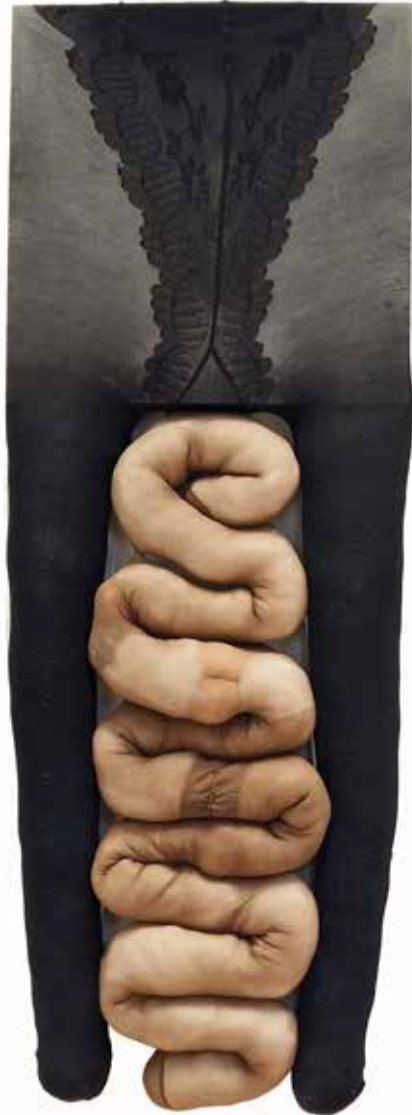
Maryam Radmehr-----40x103cm-----Fabric collage and canvas-----2022