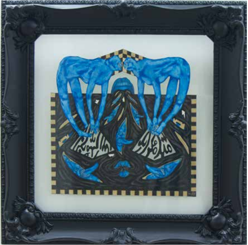
Donya Rostami-----42x42cm-----Mixed media on cardboard-----2022