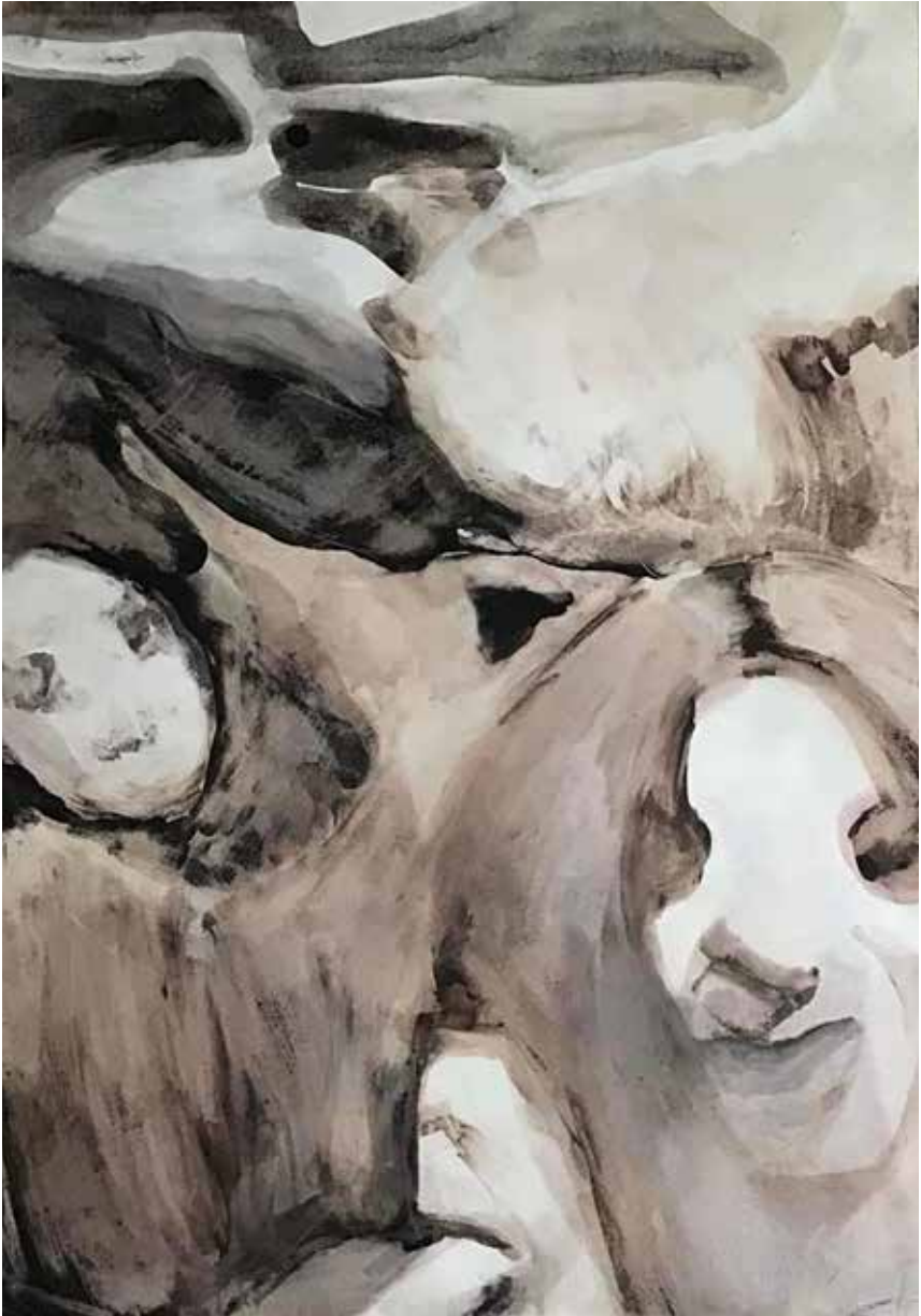
Hasti Tabatabaei-----35x26cm-----Acrylic on cardboard-----2022