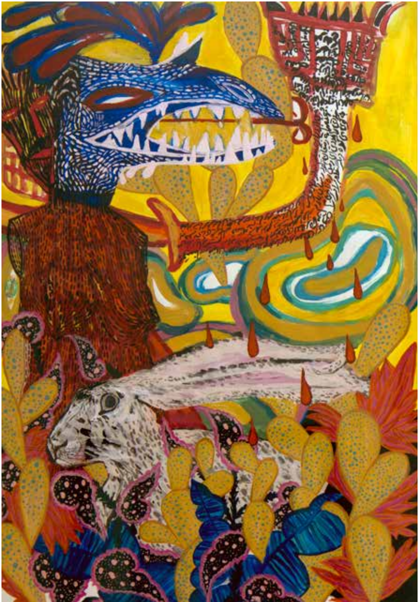
Fatemeh Mansouri-----48x68cm-----Acrylic on cardboard-----2022