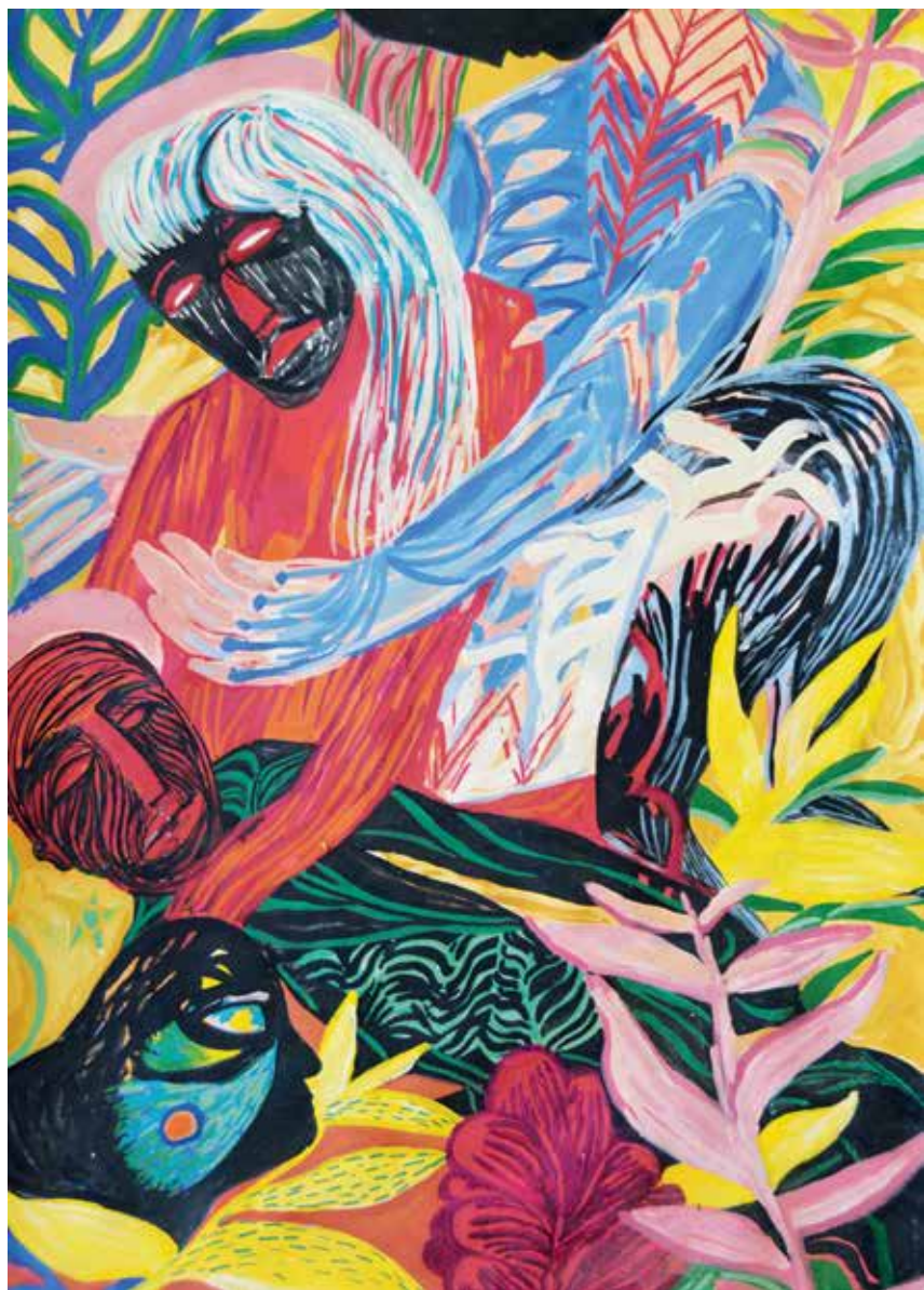
Fatemeh Mansouri-----48x68cm-----Acrylic on cardboard-----2022