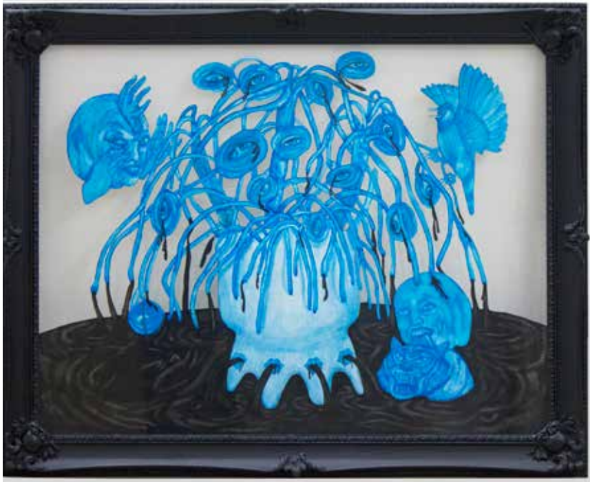
Donya Rostami-----100x70cm-----Mixed media on cardboard-----2022