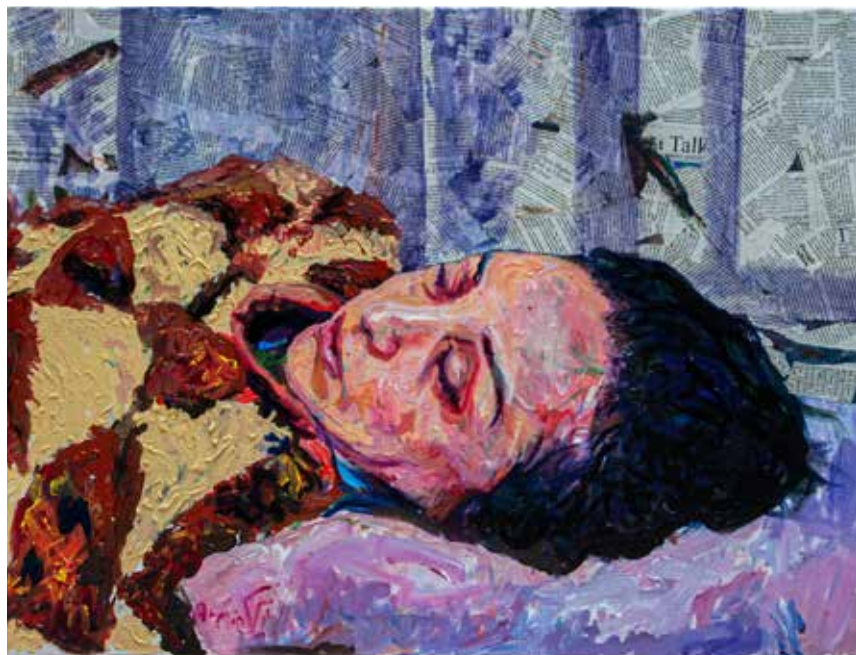
Untitled-----80x60-----Mixed media on canvas -----2022