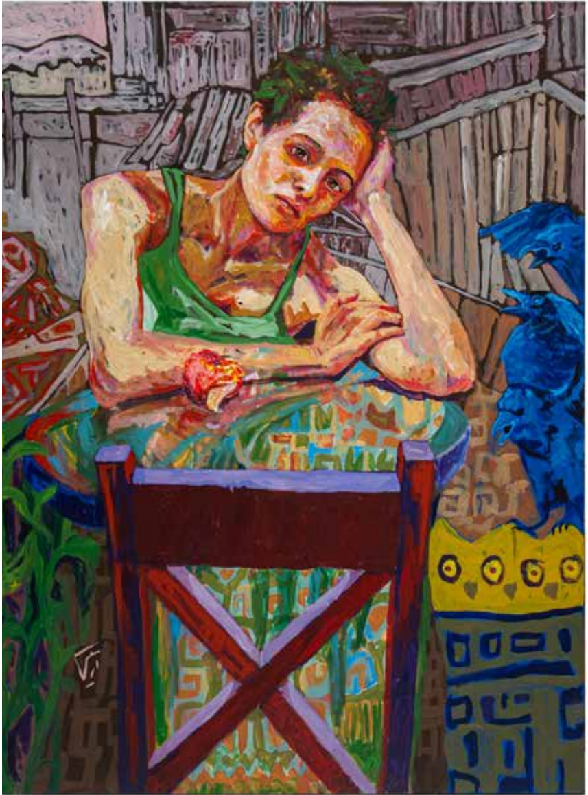
Untitled-----100x130-----Mixed media on canvas -----2022