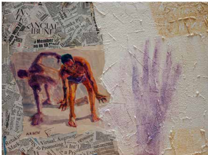
Untitled-----80x60-----Mixed media on canvas -----2022