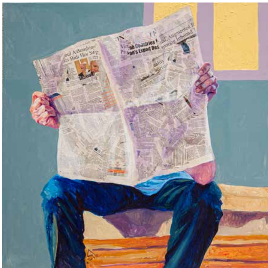
Untitled-----100x100-----Mixed media on canvas -----2022