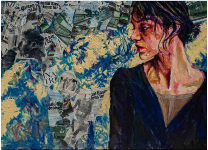
Untitled-----80x60-----Mixed media on canvas -----2022