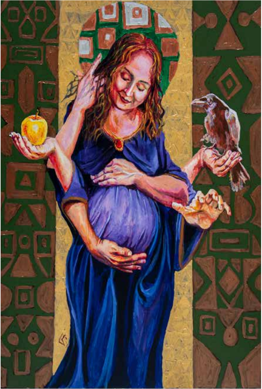
Untitled-----100x130-----Mixed media on canvas -----2022