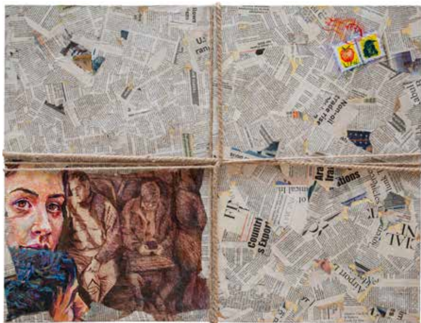
Untitled-----80x60-----Mixed media on canvas -----2022