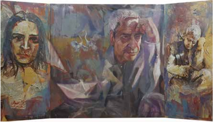
Untitled-----140x78-----Mixed media on canvas -----2022