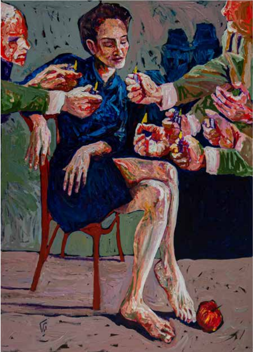
Untitled-----100x130-----Mixed media on canvas -----2022