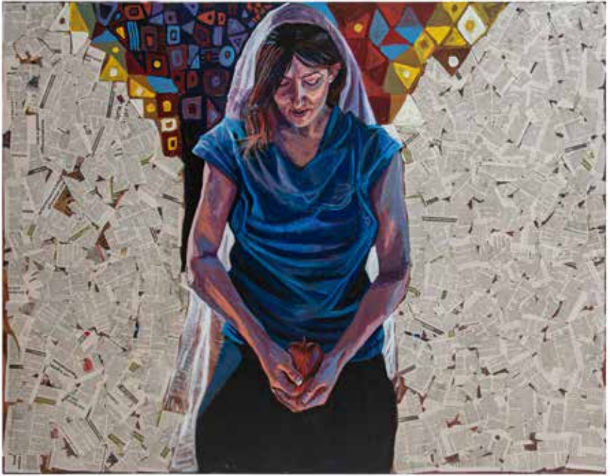
Untitled-----180x140-----Mixed media on canvas -----2022