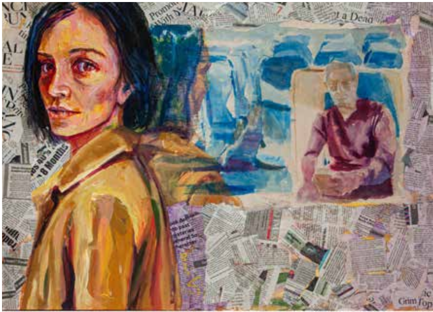
Untitled-----80x60-----Mixed media on canvas -----2022