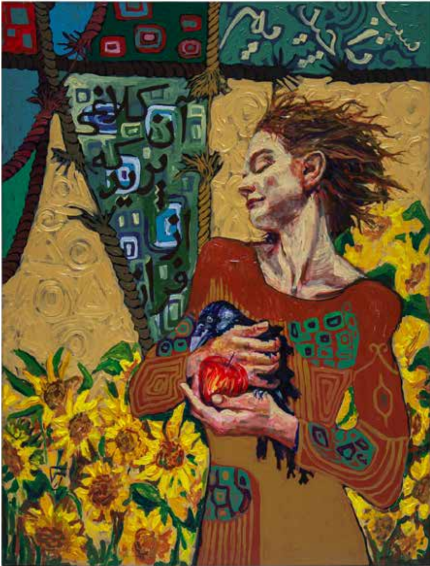
Untitled-----100x130-----Mixed media on canvas -----2022