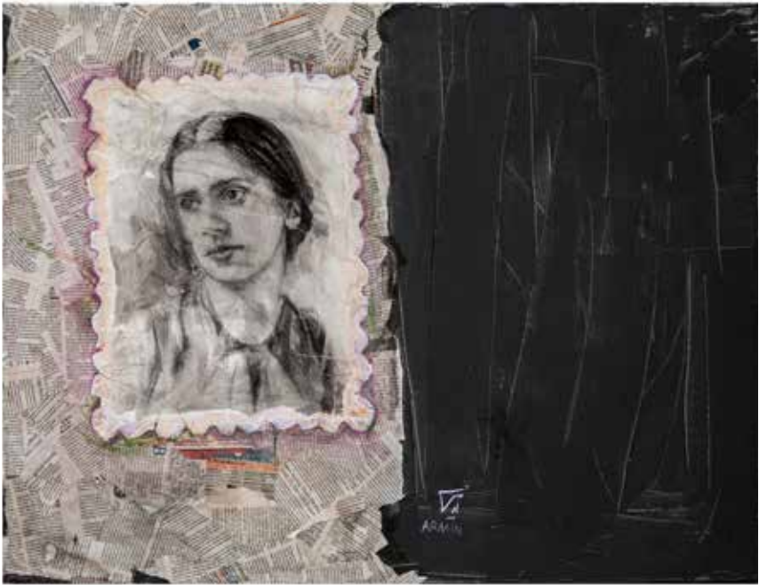
Untitled-----80x60-----Mixed media on canvas -----2022