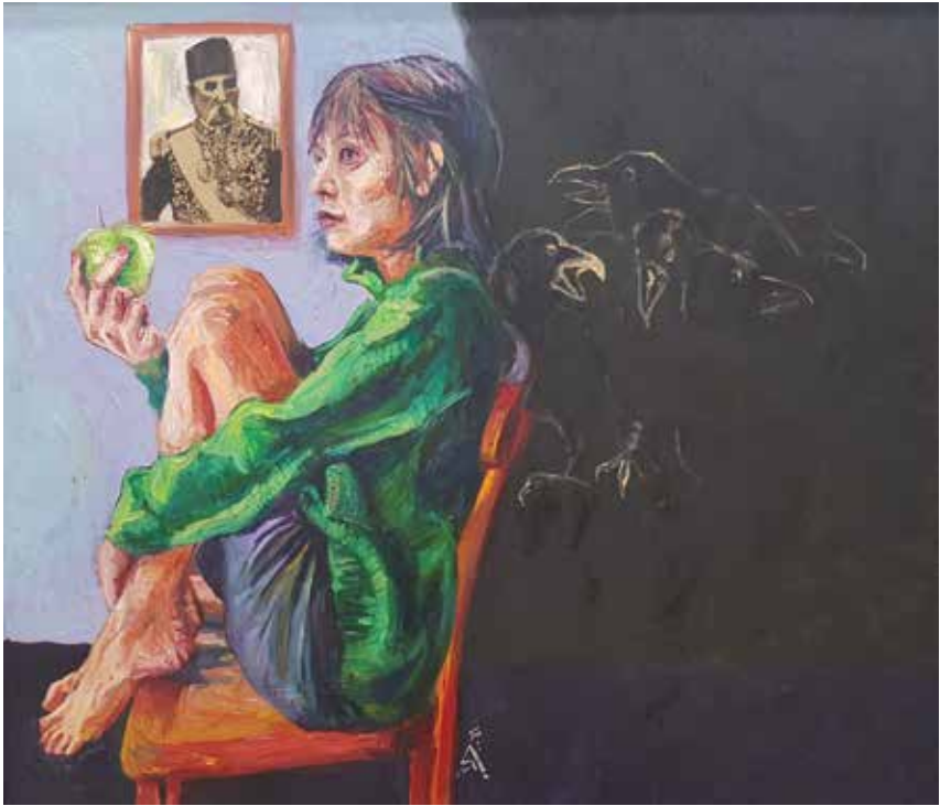
Untitled-----120x90-----Mixed media on canvas -----2022